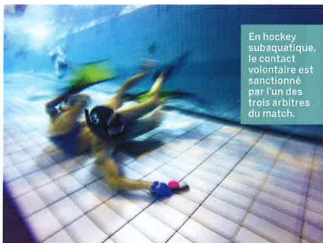
En hockey subaquatique, le contact volontaire est sanctionné par l'un des trois arbitres du match.