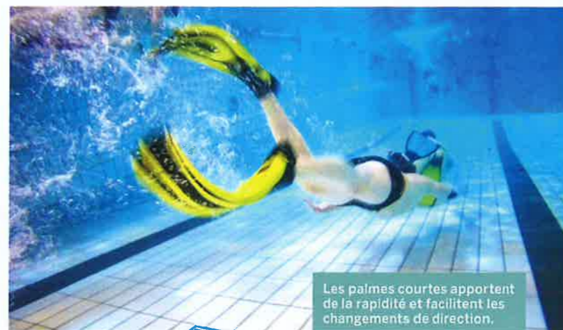
Les palmes courtes apportent de la rapidité et facilitent les changements de direction.