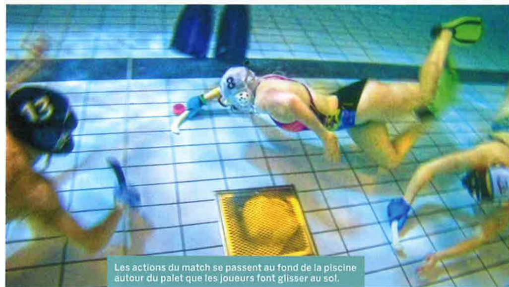
Les actions du match se passent au fond de la piscine autour du palet que les joueurs font glisser au sol.

“ C'EST TRÈS CARDIO, T'ES DANS LE ROUGE TOUT LE TEMPS ”