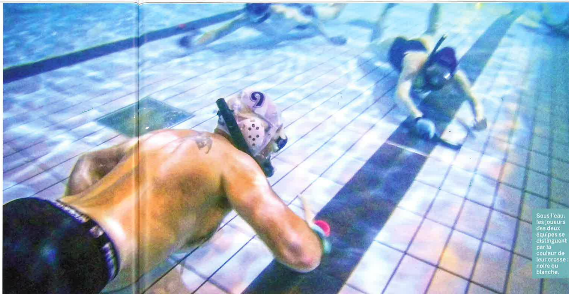
Sous l'eau, les joueurs des deux équipes se distinguent par la couleur de leur crosse : noire ou blanche.

Parmi la trentaine de licenciés en hockey subaquatique du club, nombreux sont ceux qui apprécient ce sport collectif pour son caractère engagé, ludique et cardiaque. Certains sont aussi chasseurs marins. Ils le pratiquent notamment pour maintenir la forme en hiver. Il s'agit du seul club du département mais d'autres seraient en projet. La performance de l'équipe féminine devenue vice-championne de France en D3 en avril promet une belle vie au groupe. ●